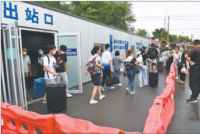
东营火车站改造提升工程明年上半年建成投用,将大大提高旅客出行的舒适度、满意度。

若之后气温仍持续在35℃以上,人防部门将根据实际情况适当延长开放时间。 “佛慧山纳凉开放时间,根据市民的需求调整到了早上七点半到晚上七点半。”辛绍涛说。