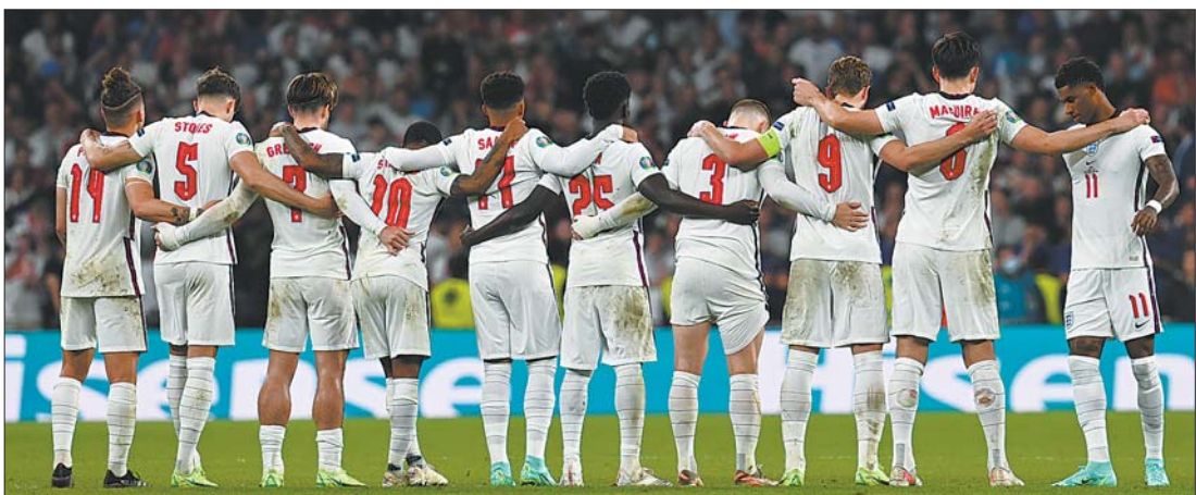
年轻的英格兰队,请勇敢追梦别放弃。

清方向,当凯恩在攻城与回撤间孤立无援,就可以看出索斯盖特终究还是用一味的保守葬送了天命,用固执般地倔强耗尽了这批年轻人的天赋,以至于将比赛拖入了英格兰人并不擅长的点球大战。