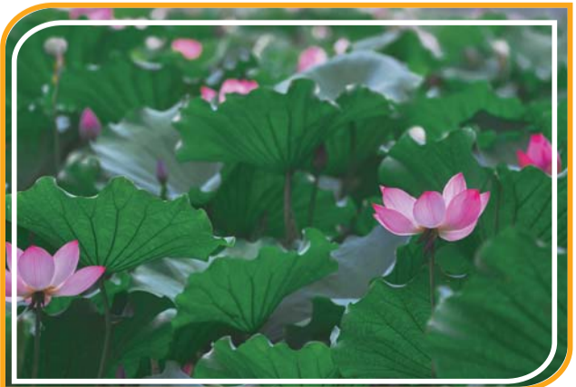
在大片绿色中,朵朵荷花格外夺人眼球。