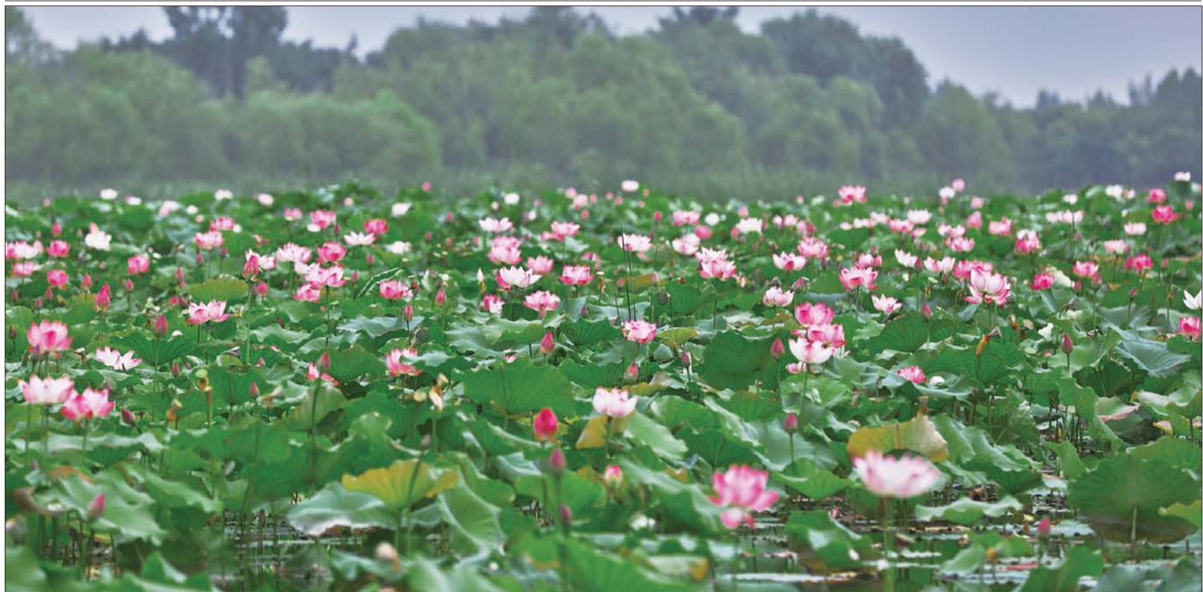
池塘碧水漾微痕,暗香来去熏。