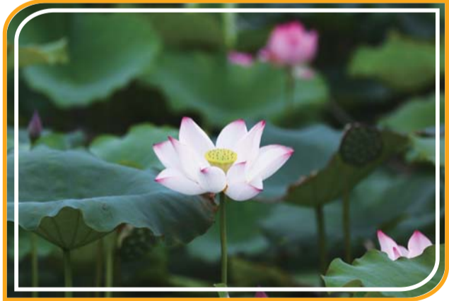
清水出芙蓉,天然去雕饰。