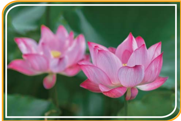
墨绿的荷叶映衬之下,荷花的色泽跳脱其间。

块无瑕的翡翠。荷塘中不时有鱼儿游过,引来白鹭翩翩起舞,绘就出一幅迷人的生态画卷。