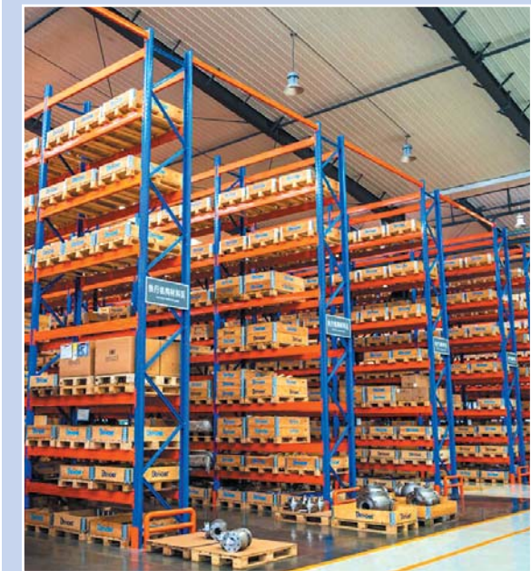
▲艾坦姆实现工业控制阀领域国际先进技术国产化。

而在此前,流体控制阀高端产品主要依赖进口。艾坦姆的建成投产打破了国外品牌在中国高端控制阀领域的垄断,实现了工业控制阀的国产化,其产品销往欧洲、中东、亚太以及国内市场。