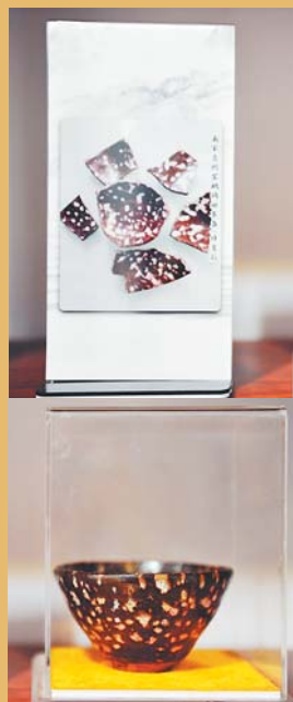
修复前和修复后的古陶瓷。