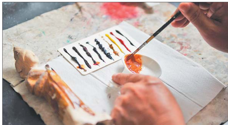
修复古陶瓷的工序繁琐复杂，前前后后大约十几种，需要耐心和细心。