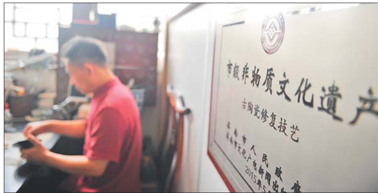
古陶瓷修复是一项传承了上百年的技艺。