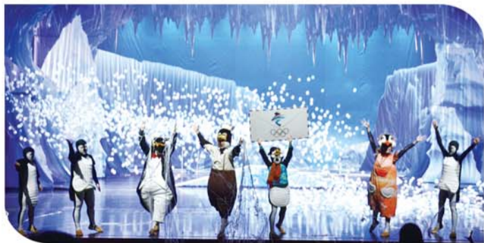
济宁市杂技团助力北京冬奥会排演的《企鹅杂技秀》也将在济宁展厅上演。