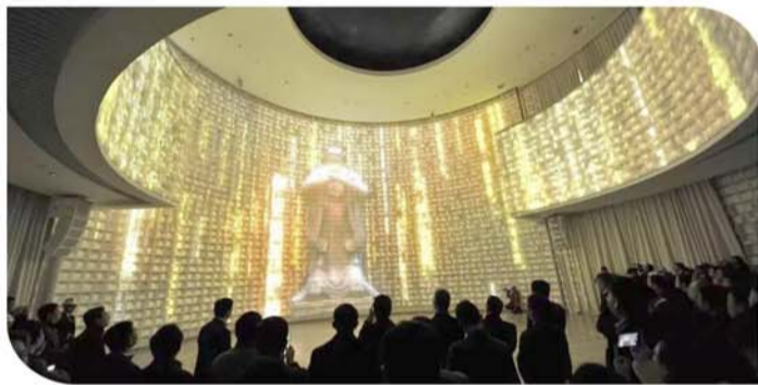
将传统文化与现代科技完美融合的孔子博物馆。

在数字产业,济宁市也异军突起。加快公共文化数字化建设,投入200万元建成济宁“文化云平台”;建成济宁市移动图书馆服务平台,全市13家博物馆建成线上博物馆;12家图书馆拥有数字化资源。建成覆盖全市23个重点景区的客流监测与指挥调度平台,实现全市重点景区的视频监控实时查看、景区客流实时监测、景区停车场监测、指挥调度等功能。