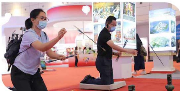
在往届文旅博览会上,游客在济宁展厅体验传统技艺投壶。(资料图)