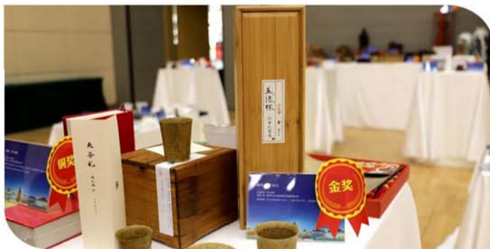
在第五届“创意济宁”文化产品设计大赛上展示的金奖作品。