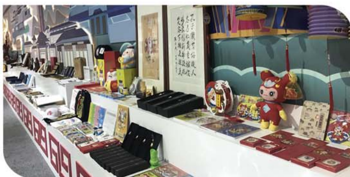
历届文旅类展会上,济宁展厅的文创产品屡获好评。(资料图)