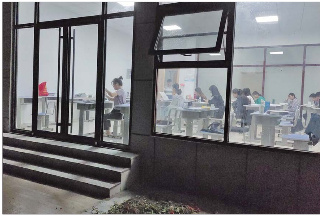
备考学子们都在认真地复习。

家教培训机构工作了两年。因为这份工作,他接触了很多成功上岸的公务员,公职体系里勇于在基层奉献自己的年轻人,给了他很大触动:我也不想平平淡淡过完这一生。