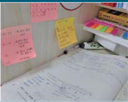
▲备考学子的桌上放满了书籍和习题集。