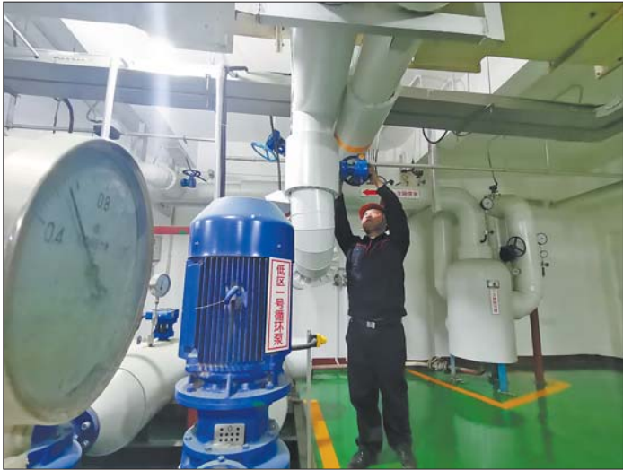
供热人员对换热站内设备进行调试。

您家暖气有水啦！随着天气转凉，供暖准备工作也开始了。济南市用热客户如果家中的暖气设施有流水的声音，请不要惊慌，这种情况是因为供热公司正在进行冷态运行。齐鲁晚报·齐鲁壹点记者了解到，自10月15日始，济南能源集团所属济南热力集团所辖供热系统逐步开始冷运行状态。西客站热源厂、金鸡岭热电厂、腊山热源厂等厂区已陆续启动，济南热力集团管理的供热辖区内的大小换热站开始逐步进入供热前的冷态运行。中新国际城、中建锦绣天地、黄金时代等小区换热站已全部启动运行。同时，热力集团全市范围内的一、二次网调节工作全面展开，为下步的热态调试打好基础。