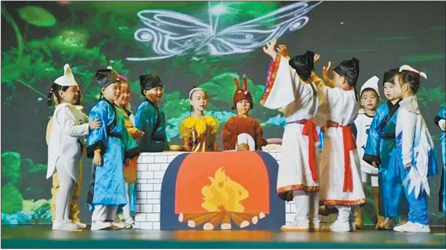
优秀传统文化走进幼儿园。

孩子是国家的未来和希望,学前教育是奠定幼苗茁壮成长的基础和基石。为切实解决“入园难、入园贵”问题,章丘区教体局深化实施“放管服”系列改革,放大普惠学前教育总量,采取一系列措施倾心倾力推进学前教育普惠优质发展,通过近年来持续不懈的努力,使章丘区学前普惠率提高了近十个百分点,全面消除无证园。