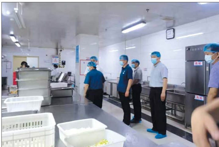
6月17日，邀请社会各界代表开展“餐饮安全你我同查”活动。

强化党建引领，提高政治站位。通过党史和政治理论的学习，党员干部更加坚定了理想信念、宗旨观念，进一步强化了“四个意识”、坚定了“四个自信”、坚决做到“两个维护”。把党建主体责任和“一岗双责”落到实处，党员领导干部率先垂范、一马当先，引领党员干部立足岗位，履职尽责，敢作敢为，真正发挥共产党员的先锋模范作用。制订《中共济南市济阳区市场监管局党组党支部工作量化考核办法》，完善对党支部的工作考核，严格落实意识形态社会热点焦点、风险点的分析和预警，及时发现、处置苗头性、倾向性问题和社情舆情，坚决防止问题扩大化。