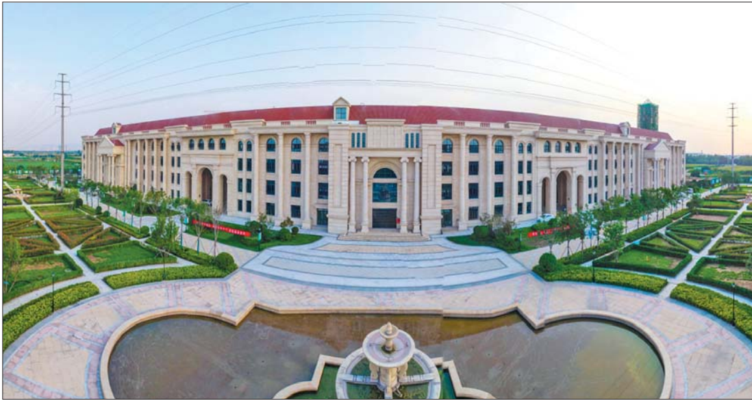
明水经济技术开发区