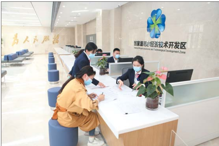
明水经济技术开发区企业服务中心。

总基调,强化分析研判,科学精准施策,做好企业服务,不断优化发展环境,千方百计为企业排忧解难,千方百计巩固稳中向好的态势,努力打造全省最好“店小二”。今年截至目前,已为企业落实各类扶持政策1.1亿元,切实保障了企业行稳发展,实现了经济平稳运行,1-10月份,规模以上工业总产值和规模以上工业主营收入均突破千亿元。