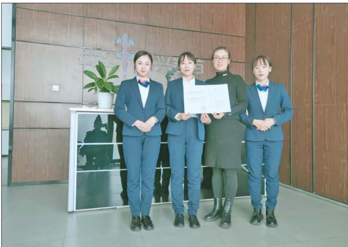
审批服务工作人员为企业上门送证。