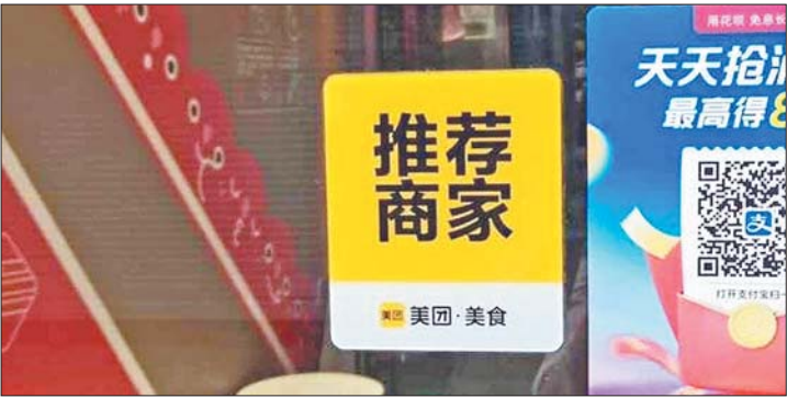
一些商家在显眼位置张贴平台的“推荐”招揽顾客。（资料片）

近日，齐鲁晚报·齐鲁壹点报道了“火锅店老板花7万多做美团推广，却被平台连续处罚”一事，店家和平台围绕“有没有刷单”各执一词。报道引发了市民和网友的热议。消费前先瞅一眼平台推荐和排名，已经成了很多人的习惯，但这些平台的高分推荐又有几分可信度呢？