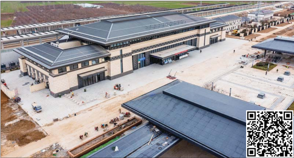
正在建设中的嘉祥北站。

鲁南高铁是国家“八纵八横”高速铁路网的重要连接通道,也是山东省“三横五纵”铁路网重要组成部分。12月7日,鲁南高铁嘉祥北站,宫殿造型的站房静静矗立,北侧的铁道与过境的日兰高速遥相呼应,不时有试运行的列车呼啸而过。这个月底,鲁南高铁荷曲段将开通运行,这里也将喧闹起来。