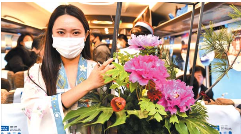
在菏泽东至北京南的列车上，一位工作人员在展示牡丹插花作品。