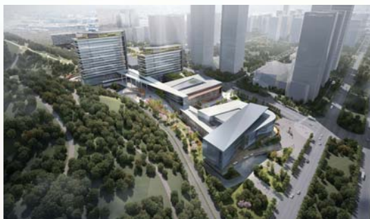
济南市中心医院东院区效果图。

济南市中心医院东院区项目，作为2021年省重点补短板和市级重点项目及自贸区济南国际医疗科技园的核心和重要载体，在各级政府部门的大力支持下，院领导高度重视，举全院之力，项目部七方专班攻坚克难，拼搏奋进，项目建设得以扎实积极稳步高效地推进。