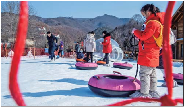
孩子们在玩喜欢的滑雪项目。