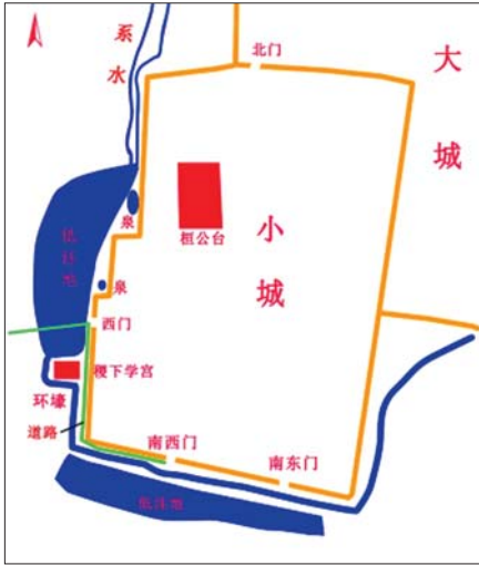
稷下学宫遗址示意图。

考古工作者还发现了一个奇怪的现象。在建筑基址群西部普遍出土铸币遗存，其中发现齐刀币范残块2500余块，为近年来全国先秦钱范出土数量之最，面范文字均为“齐大刀”，还发现少量“益化”范母和钱范以及