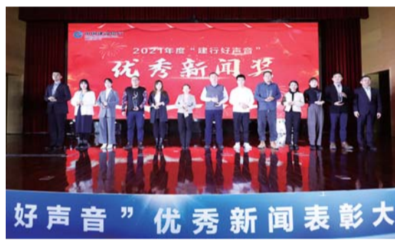
优秀新闻奖获奖代表上台领奖。

为进一步提高全行新闻宣传工作水平,全景式展示新金融发展成果和优秀新闻报道,建行山东省分行组织开展“建行好声音”优秀新闻展评活动,并于3月1日成功举办2021年度“建行好声音”优秀新闻表彰大会暨媒体恳谈会。