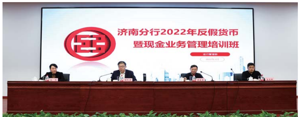
2月23日,工商银行济南分行举办2022年反假货币暨现金业务管理培训班,邀请人民银行济南分行营管部货币金银处领导现场授课。

该行还聘请外部专业培训公司高级讲师进行现场培训与指导,通过课件演示与人民币实钞现场教学相结合的方式,进行深入浅出的讲解,使参训人员直观了解和学习反假币业务知识。培训后进行现场测试,参与反假实操考试通过率为100%,进一步保障培训效果。本次反假货币培训丰富了该行现金从业人员的反假货币业务知识,增强合规意识,规范假币收缴和鉴定行为,提升该行反假货币鉴定能力,建立并完善员工的反假货币培训档案,激发员工的学习和工作热情。从而为更好地履行社会责任、营造良好的人民币流通环境、提升现金服务水平,打下坚实的基础。