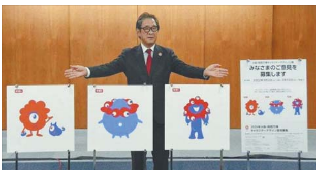
吉祥物的三个候选方案

2025年大阪世博会吉祥物3月22日揭晓,候选3号形象从三幅候选作品中脱颖而出。组委会表示,将努力使它成为广受世界各国喜爱的形象。2018年11月23日,在法国巴黎召开的国际展览局第164次全会上,日本大阪被选为2025年世界博览会主办城市。今年3月2日,大阪世博会组委会公布了官方吉祥物的三个候选方案,通过网友投票选出最终方案。