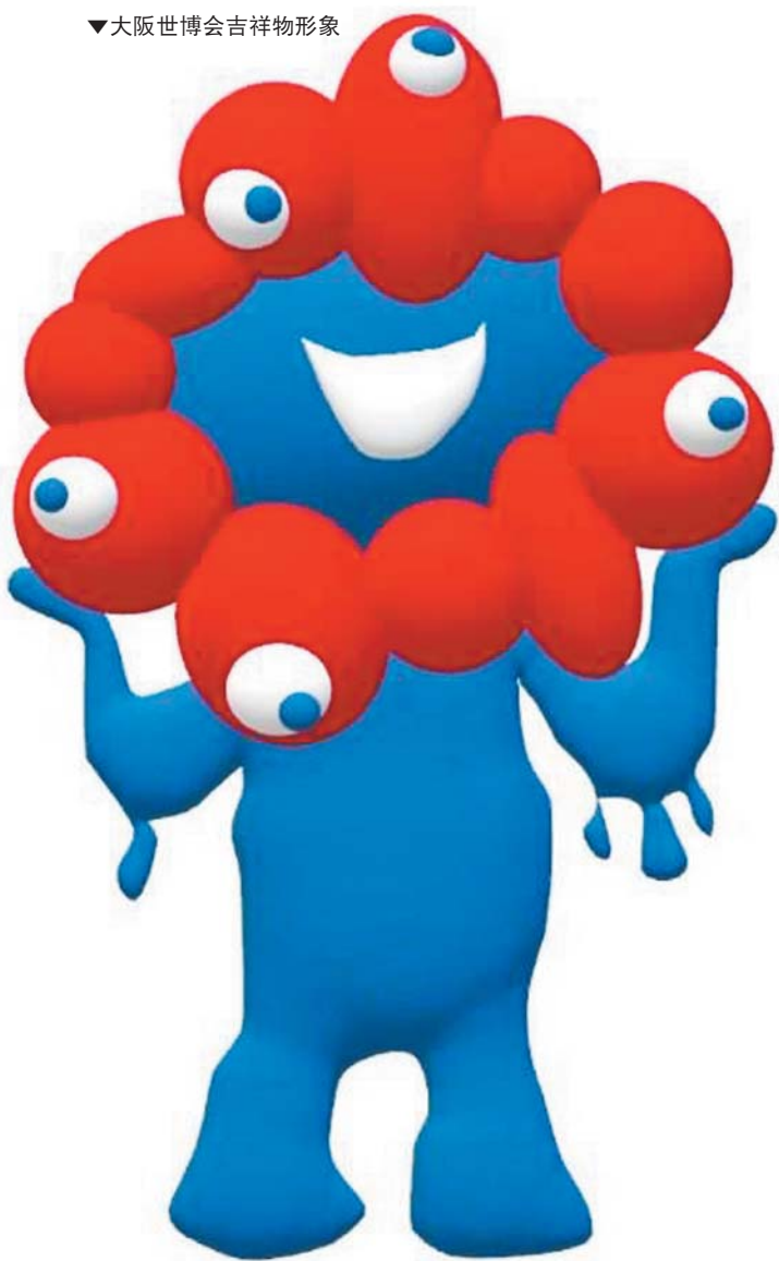
▼大阪世博会吉祥物形象