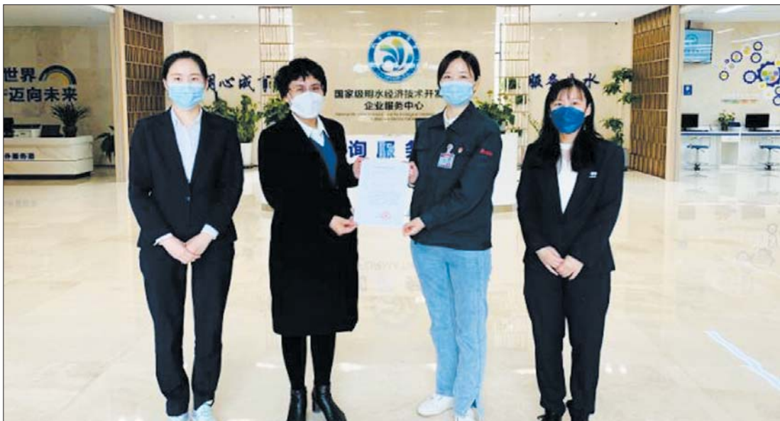
创新思路，创新方式，助力企业纾困解难。

“想不到这么快，我们一天内就拿到了新证，这多亏了开发区企业服务中心的‘云审核’。”山东颐养健康集团药业有限公司有关负责人拿着崭新的“医疗器械经营许可证”难掩兴奋，为国家级明水经济技术开发区企业服务中心的审批效率和速度频频点赞。