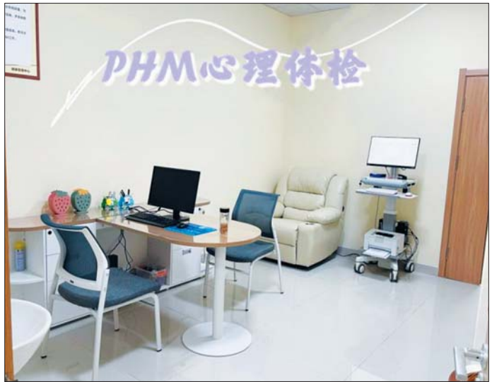
将心理健康管理纳入健康体检，开展PHM心理检测项目。

新起点、新使命、新征程。环境变了，不变的是健康管理中心全体员工守护章丘百姓健康的真心和爱心。章丘区人民医院健康管理中心将以优质的服务，更加细致呵护您的健康，成为您最贴心的健康顾问。