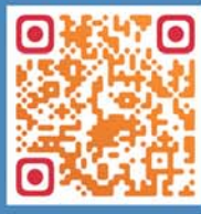
扫码查看活动门店