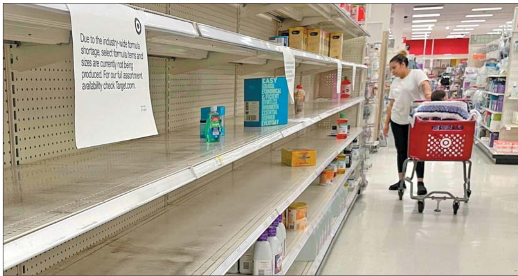
5月16日，在美国马里兰州安纳波利斯，一名女子在超市选购婴儿奶粉。

缺货严重、价格飙升，急坏了美国家长。据媒体报道，一些婴幼儿因更换奶粉出现健康问题而住院治疗。社交媒体还流传自制配方奶粉的帖子，引发医学界人士发出安全风险和营养不良的警告。