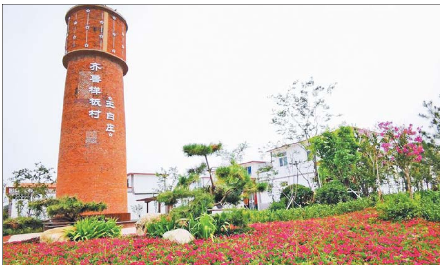
突出抓好农村人居环境整治,力争年度考核迈入第一方阵。