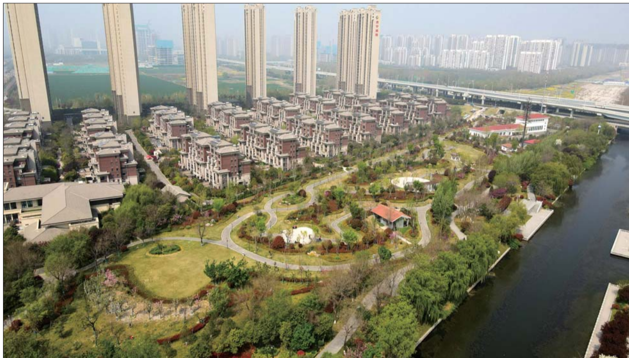
社区周边的口袋公园，成为居民茶余饭后的好去处。

夏日的济宁太白湖新区，处处充满了生机与活力，亦景亦城的城市风貌，功能完善的核心区域，错落有致的生态园林景观，让人感受到一股股汹涌的发展势头。垂柳旖旎的沿河绿化带、植被茂密的“口袋公园”，四通八达的林荫大道……处处生机勃勃，绿意盎然，描绘出一幅树绿、花繁、景美的生态画卷。