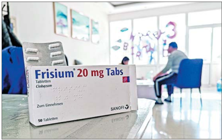
由于氯巴占紧缺，部分长期服药的家庭已经出现断药现象。(资料片)

6月29日，国家药品监督管理局发布消息，为满足人民群众对于氯巴占等国外已上市、国内无供应的少量特定临床急需药品需求，国家卫生健康委、国家药品监督管理局近日印发《临床急需药品临时进口工作方案》和《氯巴占临时进口工作方案》(以下分别简称《方案》和《氯巴占方案》)，发布了牵头进口和使用氯巴占的50家医疗机构名单。