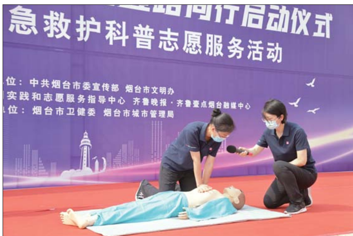
烟台毓璜顶医院救护团队现场科普急救知识。

“五为”志愿服务，与你“壹路”同行系列志愿服务活动，旨在大力弘扬“奉献、友爱、互助、进步”的志愿精神，拓展新时代文明实践中心建设。活动着眼“五为”文明实践志愿服务重点对象，为老、为小、为困难群体、为需要心理疏导和情感慰藉人群、为社会公共需要服务，进一步推动“五