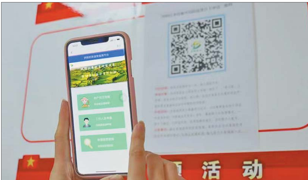
农户通过微信扫描二维码，进行自主申报和查询申报进度。

为持续巩固脱贫攻坚成果，坚决守住不发生规模性返贫底线，济阳区以科技为翼，研发防返贫监测平台，探索出了一条及时预警、快速响应、精准帮扶的防返贫监测新路子，有效破解了自主申报不畅通、行业信息共享难、审批流程耗时长等难题。让数据多跑腿，让群众少跑路，为实现全面乡村振兴赋能助力。