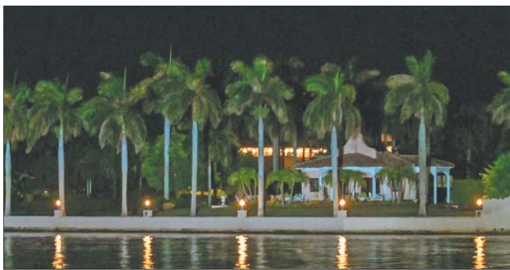
这是8月8日在美国佛罗里达州棕榈滩拍摄的海湖庄园。

有分析认为,此次对特朗普“搜家”距离11月美国中期选举只有不到三个月,民主党人可以借此在中期选举前发难,但共和党人也可能利用此事反击。《纽约时报》网站的文章说,这一事件可能是一场“高风险赌博”。长期以来,出于选举政治和集团利益,党争一直是美国政治的主题,在大选年和中期选举年则更加明显。