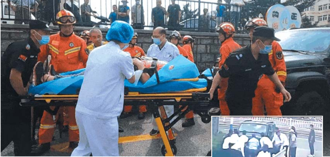
▲老太太被消防人员顺利救出，由120送往医院。 视频截图

记者注意到，根据监控视频，老太太被卷入车底后，车停了下来。路边一位正准备过马路的老大爷赶忙拄着拐杖上前敲车窗提醒司机。随后，有身着保安制服的男子和小区物业人员相继赶来查看老太太情况。在短短一分钟的时间里，从四周赶来了十几名群众，更有人从上方商业区防护栏内攀爬下来参与救援。众人合力抬车，有群众赶紧拨打了消防救