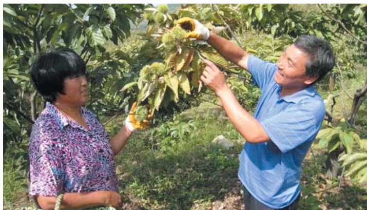
济南南部山区迎来丰收季，村民的腰包也鼓了。