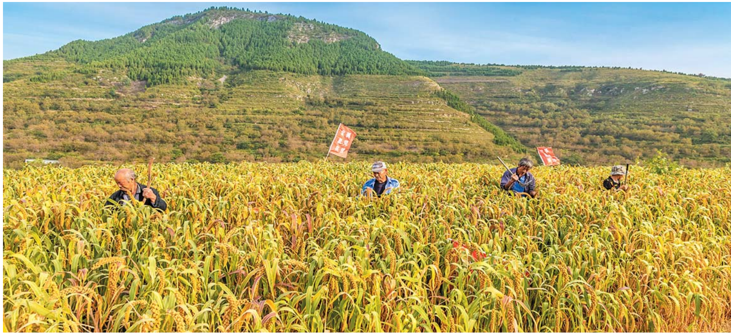
济南南部山区一片丰收气象。

在济南南部山区九如山脚下，一个村庄静静地伫立着，因村的形状形似葫芦，故名“葫芦峪”。这里植被茂密，林木覆盖率达到85%以上，目之所及皆是青翠碧绿，走进这里，仿佛走进了“天然氧吧”。葫芦峪村历史悠久，至今仍能看到留存2000多年的齐长城遗址，历经沧桑更显深邃。近日，山东省文化和旅游厅发布《2022年山东省乡村旅游重点村名单》，南部山区西营街道葫芦峪村上榜。