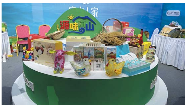
“源味南山”品牌已成为济南南部山区的名片。