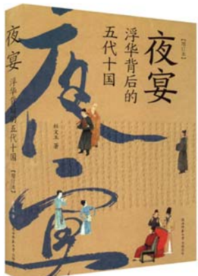
陕西师范大学出版社 杜文玉 著 《夜宴：浮华背后的五代十国》

杜文玉所撰《夜宴:浮华背后的五代十国》虽然是一本普及性读物,但有作者深厚的历史研究底蕴在内,如《南唐史略》《五代十国制度研究》等,故而该书“以史实为依据,无一字无来历,决不能虚构”,因而“本书仍然是一部严肃的历史著作,只是在写法上有所变化而已”,希望读者能将它当作历史书来读,而非文学创作。