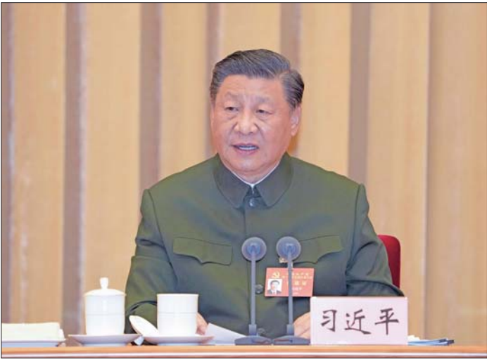
10月24日下午，中共中央总书记、国家主席、中央军委主席习近平出席在京召开的军队领导干部会议并发表重要讲话。

新华社北京10月24日电 中共中央总书记、国家主席、中央军委主席习近平24日下午出席军队领导干部会议并发表重要讲话。他强调，全军要认真学习宣传贯彻党的二十大精神，强化思想引领，强化担当作为，强化工作落实，奋力实现建军一百年奋斗目标，打开强军事业发展新局面。 中共中央政治局委员，中央军委副主席张又侠，中共中央政治局委员，中央军委副主席何卫东，许其亮同志出席会议并讲话。