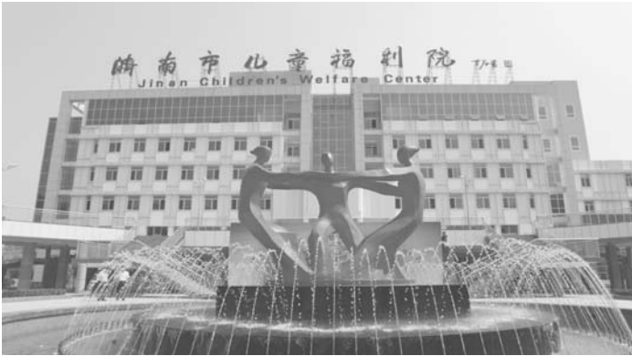
由福利彩票公益金资助建设的济南市儿童福利院，为孤残儿童提供了温馨家园。

截至2022年10月23日，我省福利彩票累计销售额突破2000亿元，达到2000.15亿元，筹集福彩公益金594.82亿元，实现了历史性新跨越。 福利彩票是国家为筹集社会公益资金，促进社会公益事业发展而特许发行的公益彩票。自1987年7月我省正式发行销售福利彩票以来，在省委省政府的高度重视和关心下，全省各级民政部门和福彩销售机构恪守“扶老、助残、救孤、济困”的发行宗旨，坚持“公平、公正、公开”的发行原则，规范管理，开拓进取，福彩事业保持平稳健康发展。