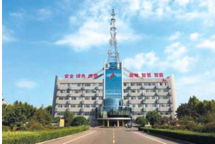
今年前三季度,兖矿能源表现亮眼。