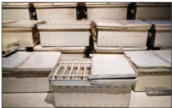
侵华日军第七三一部队罪证陈列馆内展出的细菌培养箱。