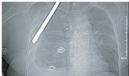
经CT检查，金属螺纹钢从女子右侧胸部穿入，贯穿体内，从左侧面部穿出。

近日，潍坊益都中心医院多学科密切协作，成功救治了一名被钢筋刺穿身体的患者。这场营救生命的“接力赛”经过1个小时的手术，107天的治疗、康复，最终将濒危患者从死神手里“抢”了回来。