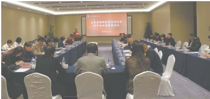
近日,山东省纺织服装行业青年企业家联盟会议在威海召开。