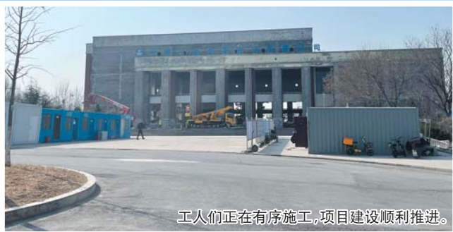
工人们正在有序施工,项目建设顺利推进。

3月1日,记者来到落户山东财经大学(原)明水校区的空天信息大学(筹),施工现场全部设置了围挡,透过围挡缝隙可以看到,工人们正在有序施工,项目建设正在顺利推进。