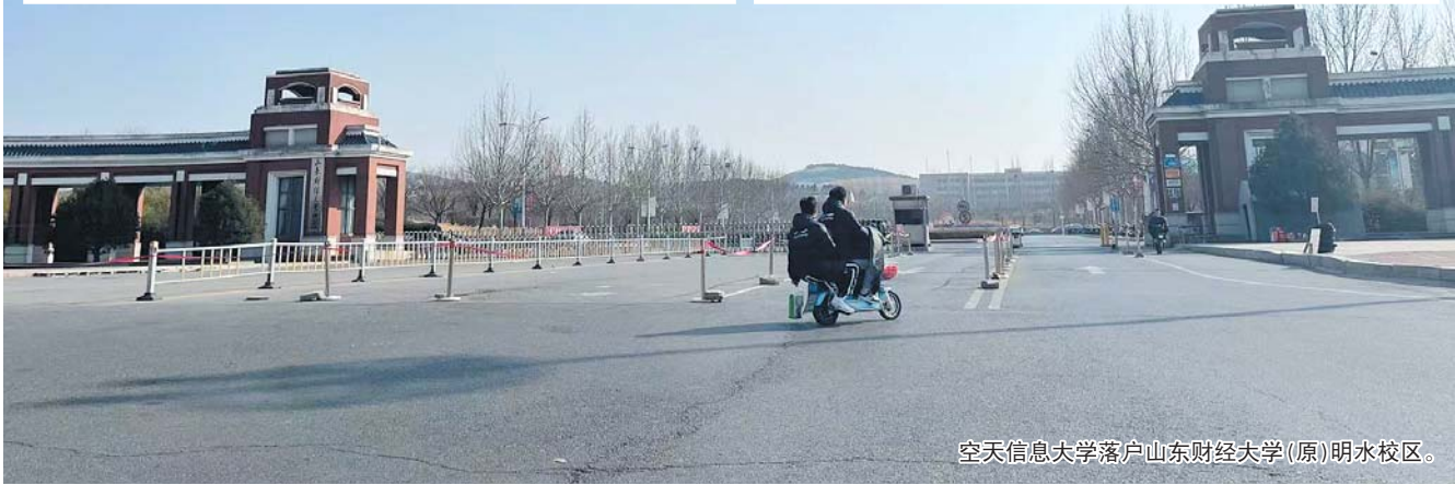
空天信息大学落户山东财经大学(原)明水校区。