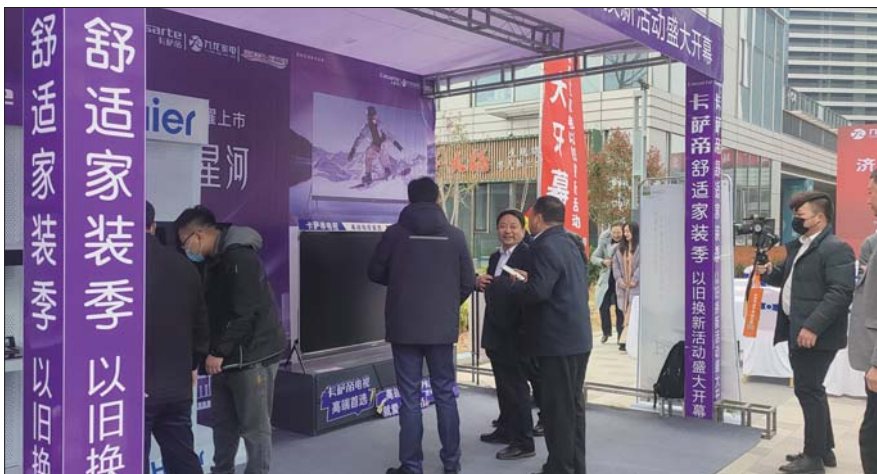
工作人员介绍优惠政策。

本报济宁3月20日讯(通讯员 宋敏) 3月17日，济宁市家电汽车下乡暨太白湖新区家电以旧换新活动启动。