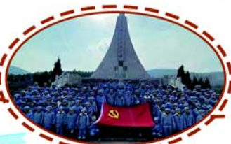
八路军抱犊崮抗日战争纪念馆