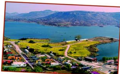
翼龙湾柁族部落景区