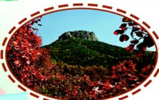
抱犊崮国家森林公园