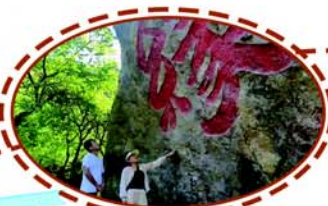
熊耳山国家地质公园