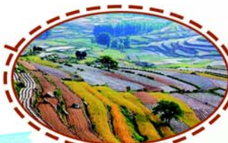
徐庄镇湖沟乡村公园