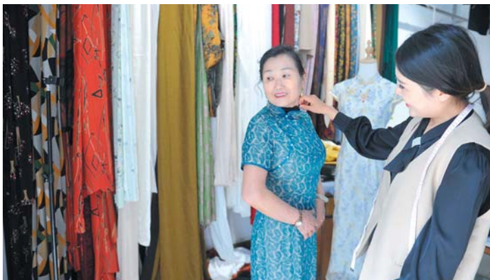
顾客来店里试穿样衣后,对美丽的手艺非常满意。