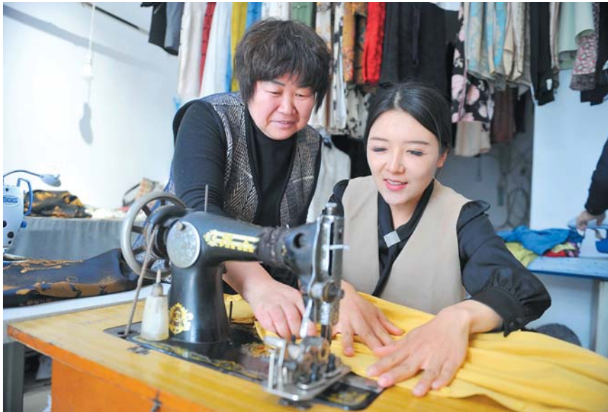
美丽和婆婆正在缝纫机前忙碌着。美丽操作的这台缝纫机是婆婆14岁时买的第一台缝纫机,至今还在使用。