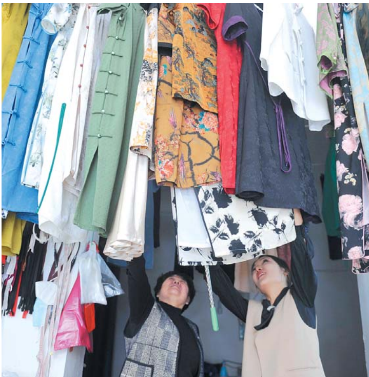
店里挂着的全都是给顾客做好的衣服,以各种花色和样式的旗袍为主。