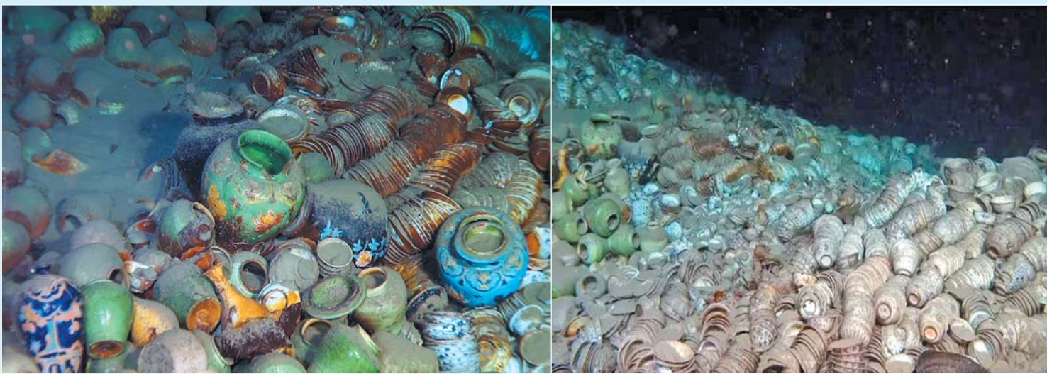
这是南海西北陆坡一号沉船内部(2022年10月摄),各种瓷器保存完好,场面十分震撼。

zhī liào 知了 6月11日清晨,随着“探索一号”科考船抵达三亚,南海西北陆坡一号、二号沉船第一阶段考古调查工作顺利结束。历时20余天,21个潜次工作,神秘的古代沉船,历经500多年沉寂后,与深海考古队相约在万顷碧波之下。那么,数百年前,这两艘船是从哪里来,又要到哪里去?超十万件“宝贝”背后,到底藏着怎样的故事? 记者 于梅君