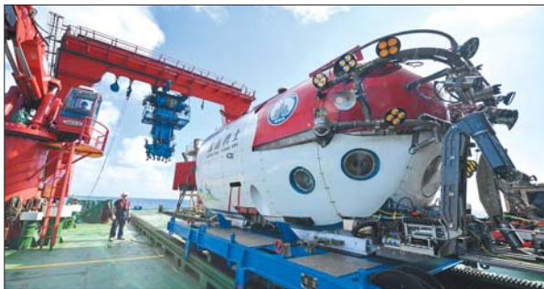
“深海勇士”号载人潜水器用于水下考古数据采集。

另一方面,也展示了深海科技与水下考古跨界融合、相互促进的前景,标志着我国深海考古向世界先进水平迈进。 下一步,将分三阶段实施这两艘沉船遗址的考古调查工作。第一阶段从5月20日持续至6月上旬,使用载人潜水器,摸清沉船分布范围;第二、三阶段计划于2023年8月至9月,2024年3月至4月实施。全部调查结束后,相关部门将提出下一步考古和遗址保护方案。