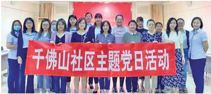
把党建“软环境”做成促进区域发展的“硬实力”。

历下区千佛山街道现有商务楼宇12个,入驻单位512家,建立党组织29个,共有党员1074名。近年来,街道党工委聚焦区域内重点楼宇,积极推进以“善治理”为主要特征的楼宇党建模式,加强楼宇党建的凝聚力、影响力、辐射力,推动基层党建、社会治理、营商环境互促共进,把党建“软环境”做成促进区域发展的“硬实力”,为街道经济社会发展不断注入新活力。