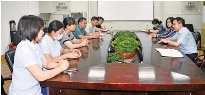
开展各类讲座和知识培训,助力楼宇经济发展。

构,楼长采用轮值东道主制,从楼宇成员单位中选取人员担任,一月一轮值,另设党建指导专员、招商联络专员、法律咨询专员、帮办代办专员、政策讲解专员、物业管理专员。其中,党建指导专员、招商联络专员由街道办事处相关科室人员担任,法律咨询专员由楼宇内山东明齐明律所工作人员担任,帮办代办专员由驻地社区工作人员担任,政策讲解专员由经济网格员担任,物业管理专员由华特物业管理公司工作人员担任。