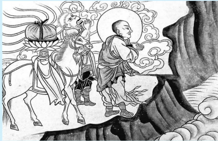
榆林窟第3窟东壁南側普贤变中玄奘取经图。