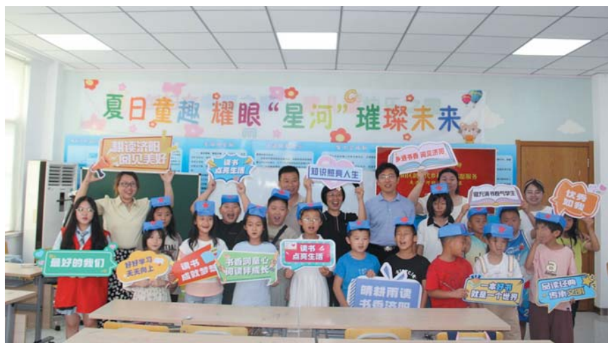
志愿者带领孩子们学习了“闪闪的星星”课外绘本,激发了他们对红色文化的喜爱之情。

书屋阵地,不断开展相应阅读活动,开展优秀读物推荐、读书分享等阅读推广活动,用文化浸润乡风文明,以实际行动推