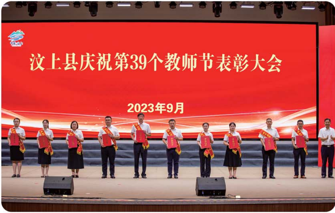
教学质量优胜个人在大会上获表彰。