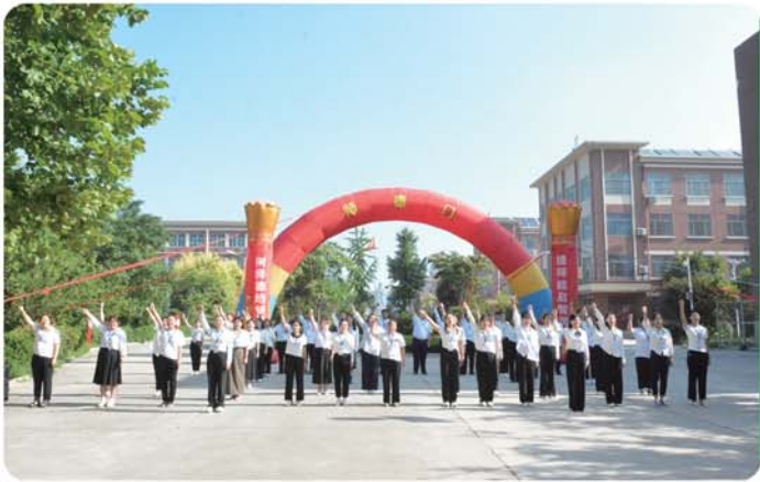
新入职教师走过“师德门”。

作为流传了“孔子宰中都”这一千古佳话的热土，自古以来，汶上县便重文尚贤，科教兴盛。近年来，汶上县的教育工作更是在县委县政府的坚强领导下，以建设教育强县、打造全省教育高地为目标，加强党对教育工作的全面领导，以党建示范校建设和“一校一品”品牌创建为抓手，稳慎推进党组织领导的校长负责制，促进党建与教育发展深度融合。坚持“立德树人、培根铸魂”党建品牌；塑造“儒乡靓校”校园品牌；铸就“学在汶上”教育品牌，全力书写“强教兴县”奋进之笔。