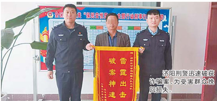
济阳刑警迅速破获诈骗案，为受害群众挽回损失。

那么，“刷单”等电信诈骗背后有啥“套路”，市民应该如何防止被骗？近年来，济南市公安局济阳分局刑警大队与电信诈骗分子斗智斗勇，打掉了多个“帮信”犯罪团伙。