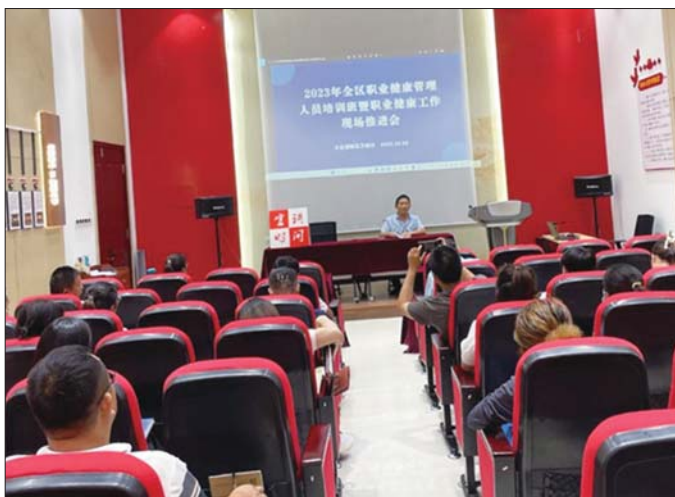
开展职业健康培训。

下一步，区卫健办将深入贯彻职业病防治工作机制，压实各企业和劳动者职责，认真组织开展职业病危害源头治