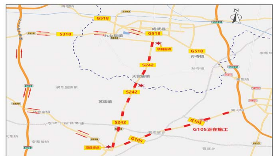
图例: 绕行路线 (dashed line with arrows) 施工路段 (dashed red line)