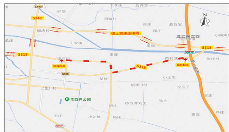
图例: 绕行路线 (dashed line with arrows) 施工路段 (dashed red line)