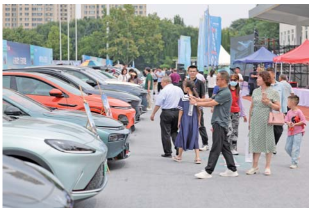
“2023山东新能源汽车百场下乡活动”在淄博市淄川区启动。

自1999年至2023年,由齐鲁晚报主办的齐鲁国际车展已经连续举办了48届,成为齐鲁大地规模最大、品牌最全的汽车盛宴。齐鲁晚报·齐鲁壹点借助齐鲁国际车展的品牌优势和汽车办展经验,发挥融媒宣传、资源整合、群众基础、政务服务等方面的优势,策划新能源汽车下乡系列活动,预计将有50个汽车品牌、1800家车企近百种车型参加。活动旨在助力扩大汽车消费,促进农村地区新能源汽车推广应用,引导农村居民绿色出行,助力美丽乡村建设和乡村振兴战